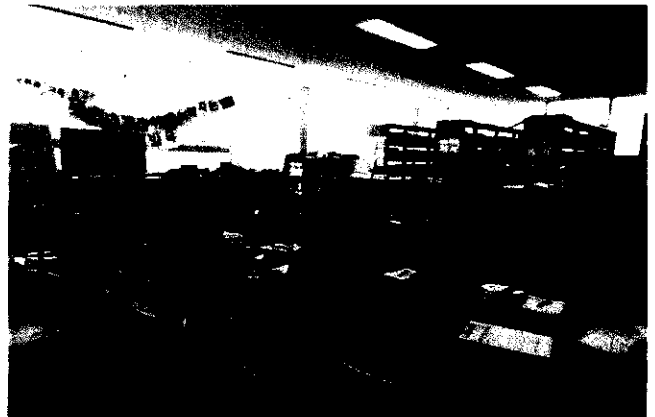
△ 독서문화 행사 사진(부모 교육)