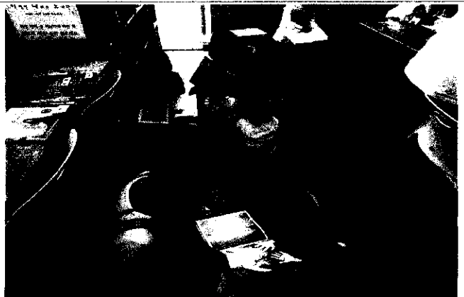
△ 독서문화 행사 사진(어린이에게 책임어주기)