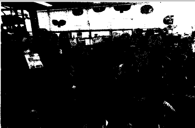
△ 독서문화 행사 사진(석수골 생일잔치)