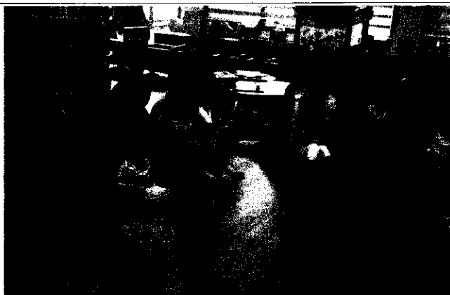
△ 독서문화 행사 사진(북스타트 책놀이)