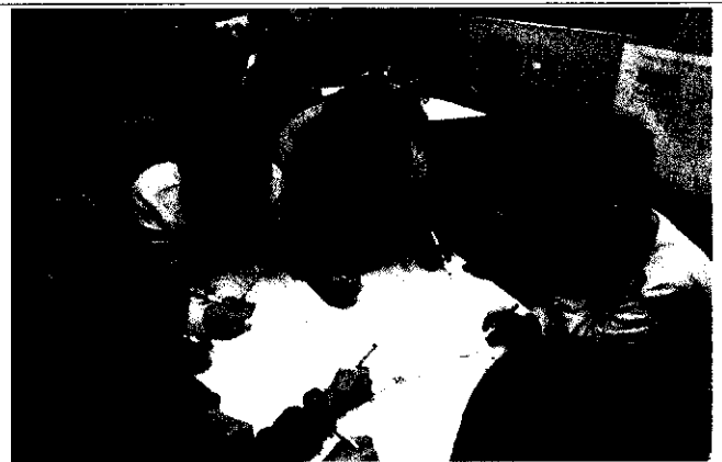
△ 독서문화 행사 사진(독서동아리 활동)